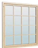
1.62×1.885 м.2 шт.