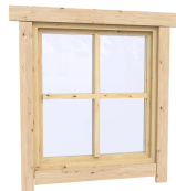
0.87×0.78 м.4 шт.