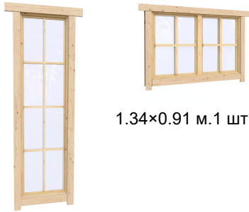
1.34×0.91 м.1 шт.